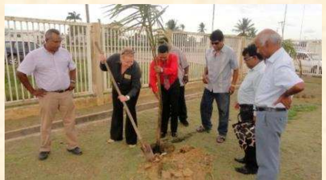
Plantation d'arbres à l'hôpital de la Nouvelle-Amsterdam