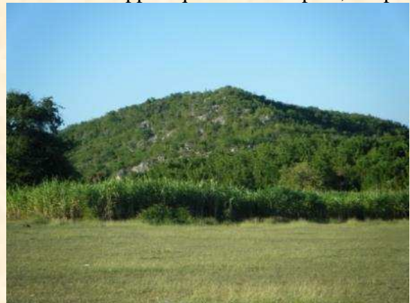
Site de l'école du Rotary (Nippes)

Le lendemain, était censé avoir impliqué la plantation d'arbres et affichage de certains des projets de la RC de Pétiion-Ville, ainsi que certains réunion formelle des deux districts, 7020 et 7030, la DG 7020 est celui de Haïti. Malheureusement, leur DG était dans une autre partie d'Haïti, et personne n'était disponible pour accueillir notre équipe. Ainsi, nous utilisé notre chauffeur et loué voiture pour visiter la Galerie d'art Nader, pleine de sculptures et d'art haïtien incroyable. Ceux-ci se révéla pour être très cher, donc nous avons acheté plus tard l'oeuvre du côté de la route. Nous avons appris que si vous à pied, les prix