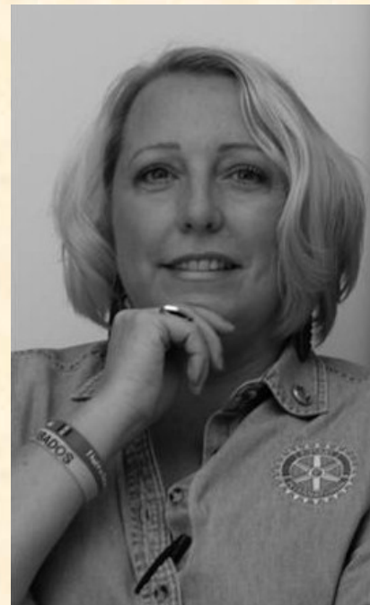
Gouverneur de district: Lara Quentrall-Thomas.