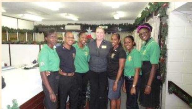
Rotaract New Amsterdam

La fin de la semaine avec un merveilleux dîner commun parmi les 4 clubs de Georgetown, où les Rotariens et leurs partenaires de service jouissent fellowship, humour et musique classique de Noël fournis