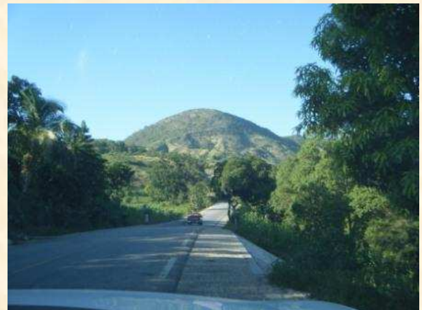
Voyager à Nippes