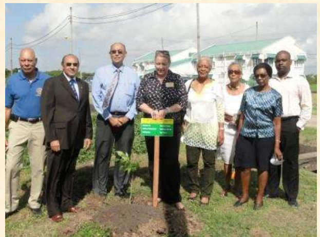
Plantation à l'Université du Guyana.